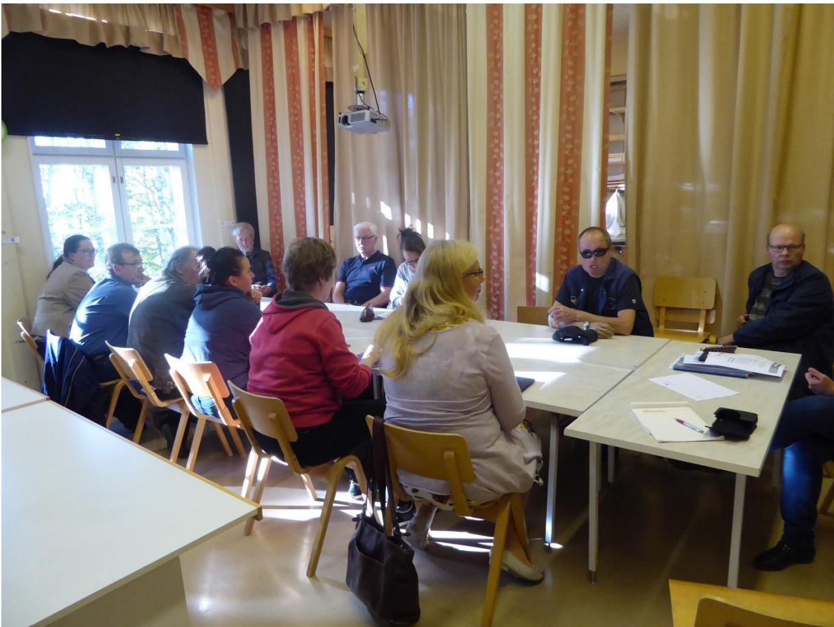
Kuva 12.9. palaverista Suinulan kylätalolla. Osanottajia oli kaikkiaan 13 henkilöä.