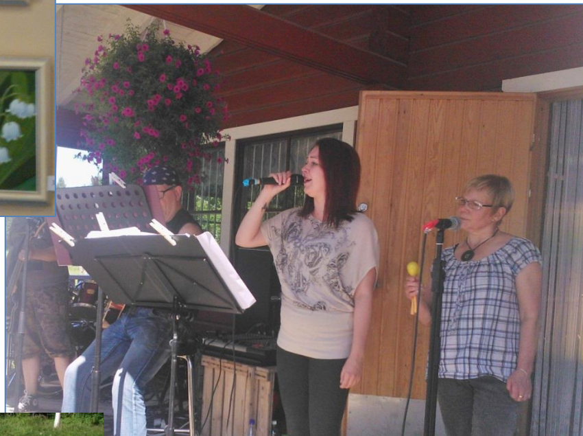
Hypno&Angles viihdytti musiikilla Suinutuvalla Toripäivänä.