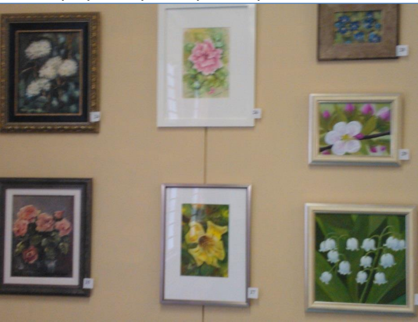
Mäntän Taideseura ry:n näyttelyä Suinulan koululla. 6.-7.7.2013.