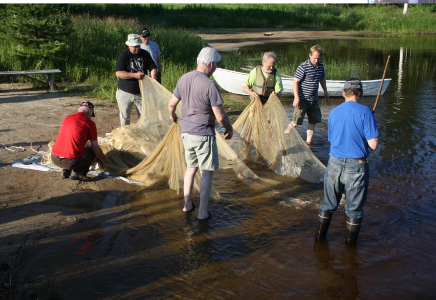
Suinurannassa miesten nuotanvetonäytöstä seurasi iso joukko kiinnostuneita. Saalis oli pienehkö ,reilu kuusi kiloa tällä kertaa.